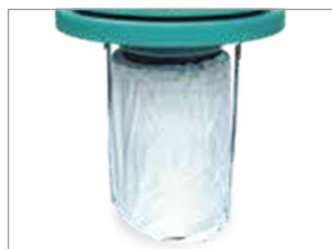
FILTRO CARTUCHO HEPA H14 PRÉ FILTRO POLYCARBON