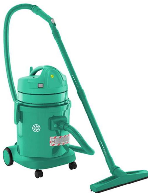
GP 1/27 HEPA ISO5